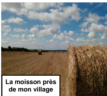
La moisson près de mon village